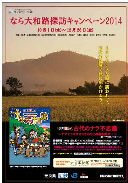
キャンペーンパンフレット