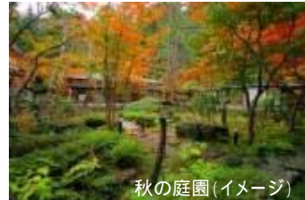
秋の庭園(イメージ)