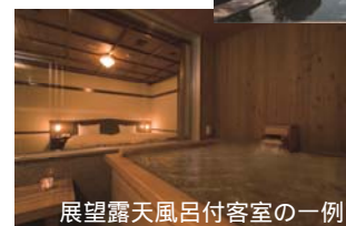
展望露天風呂付客室の一例