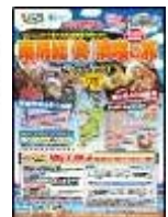
専用パンフレット