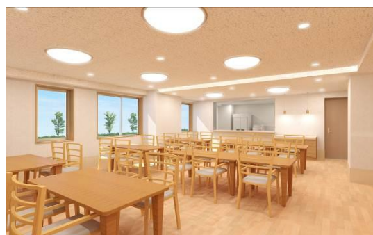
レオーダ経堂・ダイニングルーム（イメージ）