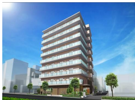
レオーダ成城・外観（イメージ）