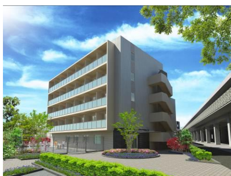
レオーダ経堂・外観（イメージ）