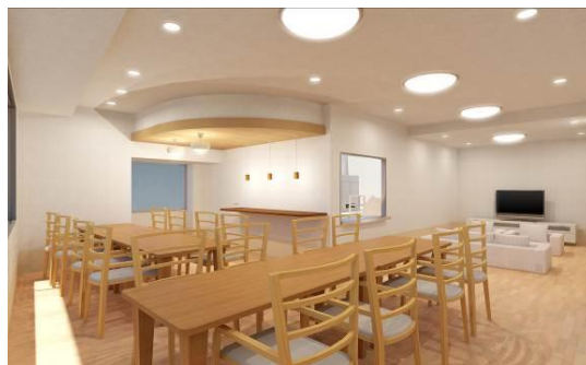
レオーダ成城・ダイニングルーム（イメージ）