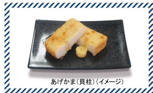
あげかま(貝柱)(イメージ)