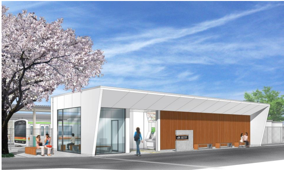
新駅舎（完成イメージ）