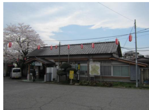
現状の駅舎（建築年 1931年）