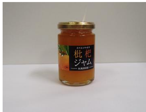
売店で販売する「びわジャム」

「鋸山サマーフェスティバル」は、お客様に夏の鋸山を親しんでいただく目的で、毎年開催しています。今回は、南房総の特産品で皇室にも献上されている「房州びわ」がテーマです。