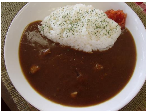
山頂食堂で販売する「びわカレー」