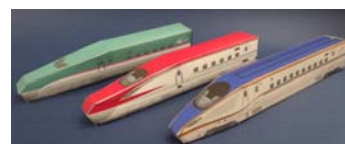
【ペーパークラフト完成イメージ】