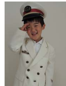
【子供用制服の写真撮影イメージ】

すべてのワークショップ参加費は無料です。 会場の状況により入場を制限する場合がございます。