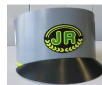
【駅員制帽サンバイザー完成イメージ】