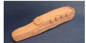
【もくねんさん完成イメージ】