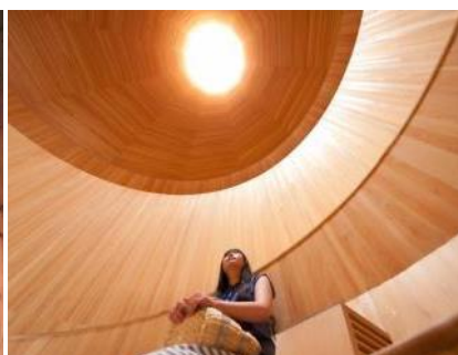
氷室開き/冷風体験

展望台の開業日にあたる7月13日に、密閉していた氷室の扉を開放します。六甲山に吹く風を氷室の内部に取り込み、自然のエネルギーのみで涼風を作り出します。氷が溶けて無くなるまで冷風体験ができます。