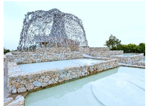
自然体感展望台 六甲枝垂れ 外観

通常、「氷室」の内部は一般公開していませんが、「氷室開き」を行う7月13日(日)には氷室の内部を特別に見学していただける機会を設け、一般から募集を行い、20名様を無料招待します。