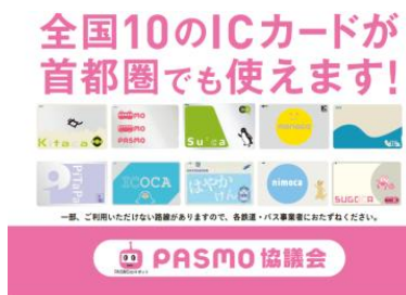
ポケットティッシュのデザイン