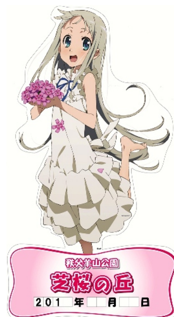
めんま等身大POP イメージ