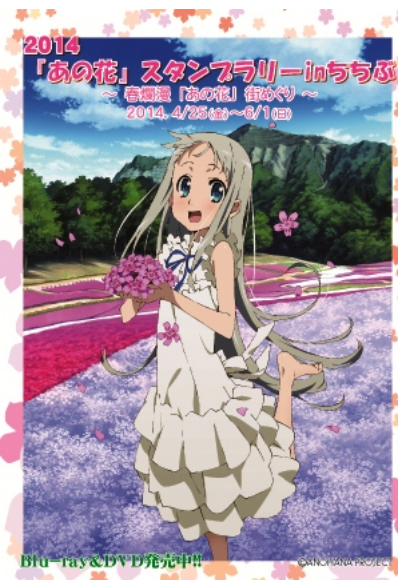
スタンプラリーシート（表） イメージ