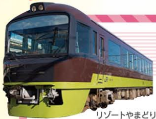
リゾートやまどり

花と新緑がいっぱい！行楽にピッタリの栃木に便利で楽しい列車でお出掛けしませんか？