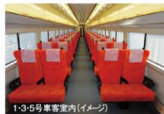
1・3・5号車客室内(イメージ)