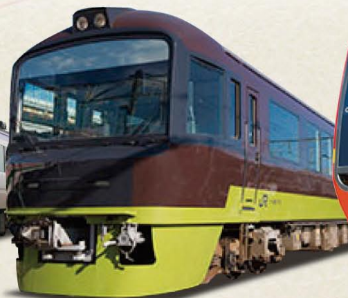
リゾート那須野満喫号