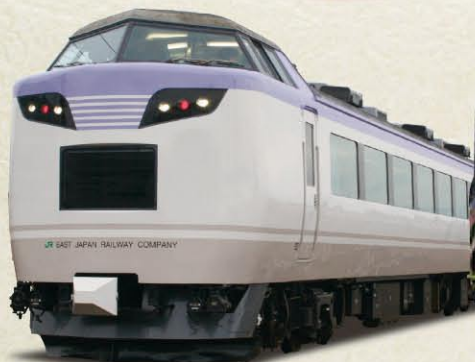
いろいろ山梨さくらんぼ号