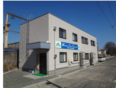
研修棟 (H26.3 新設)