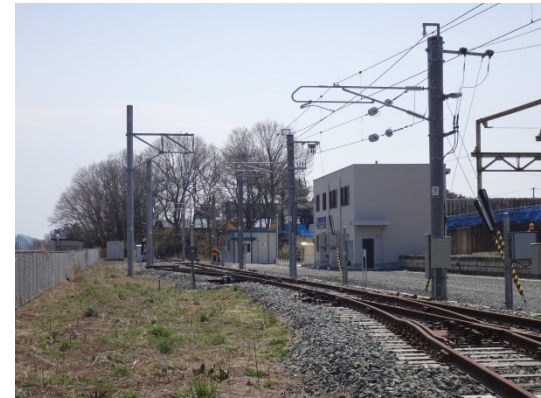
村崎野イートアップトレーニングセンター全景