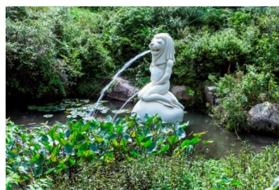
がっかりトリプル/現代美術二等兵