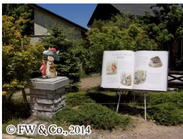
絵本の世界へ 「おはなしをめぐる散歩道」