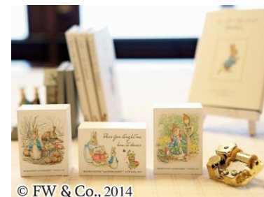
六甲ガーデンテラス限定 ピーターラビット™グッズ登場