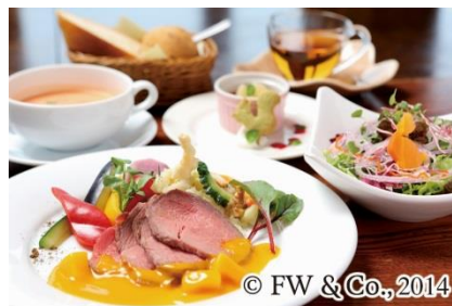
ピーターラビット™と仲間たちの 特別ランチ&スイーツ