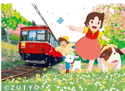
[店舗名]小田急百貨店新宿店 催物場 [商品名]ハイジグッズ(イメージ)