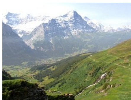
[店舗名]小田急トラベル [商品名]スイス旅行(イメージ)