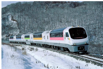
変更前の車両（ノースレインボー車両）