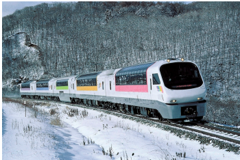
変更前の車両（ノースレインボー車両）