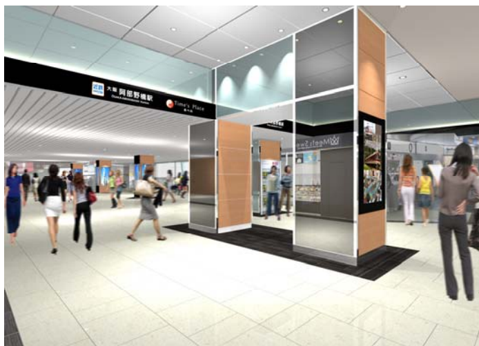
「Time's Place あべの」 エントランス部イメージパース