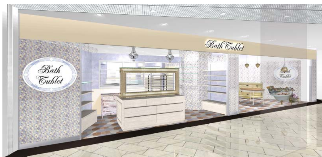
「Bath Tublet」店舗イメージパース

(2) 改札の内外に広がるショッピングモールの柱を木目と墨色の素材によって美装し、空間の統一感を高めます。また、地下鉄・JR天王寺駅東口から近鉄大阪阿部野橋駅東口に入る部分をメインエントランスと位置づけ、木目と墨色の素材に加えて、ガラスやミラーなどの透明感のある素材も用いて柱や壁を美装することにより、スタイリッシュで都会的なエントランス空間とします。