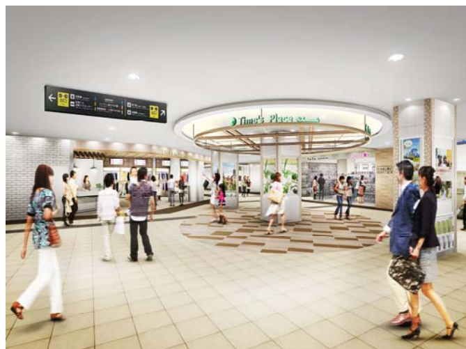
「Time's Place 上本町」 エントランス部イメージパース