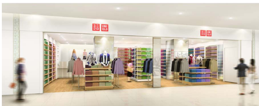
「ユニクロ」店舗イメージパース