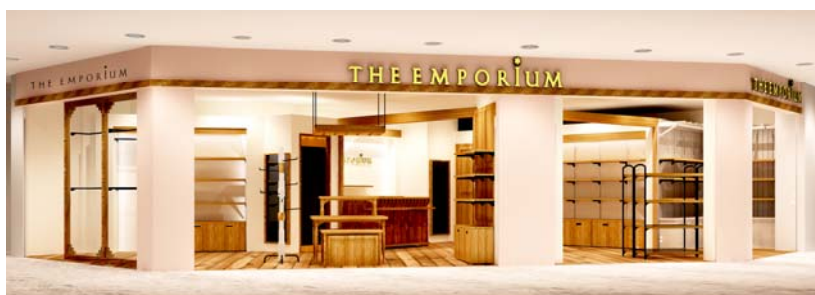
「THE EMPORIUM」店舗イメージパース