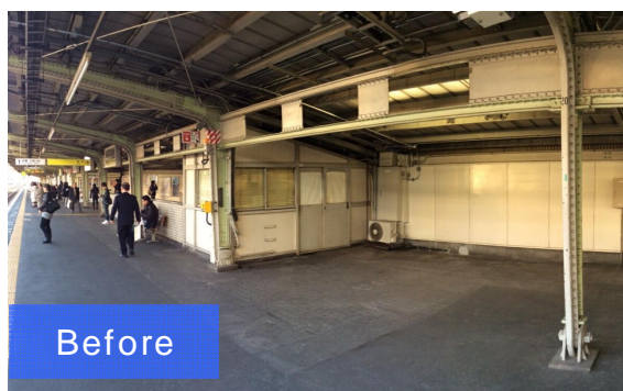
Before 暗く、あまり活用されていないスペース (森ノ宮駅 1番のりば 大阪方)