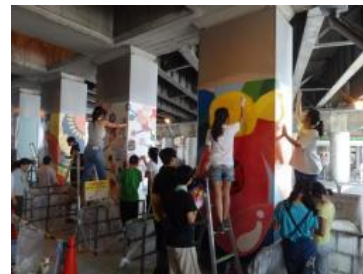
地元中学生の皆さんと高架下アート制作