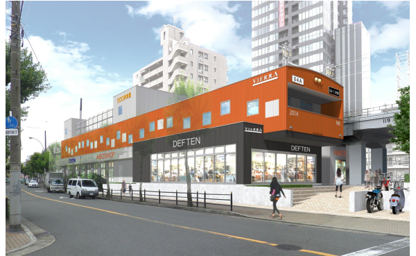
ピエラ玉造外観イメージ