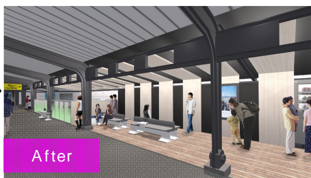
After ホーム上の「コミュニケーションスペース」として活用 (イメージ図)