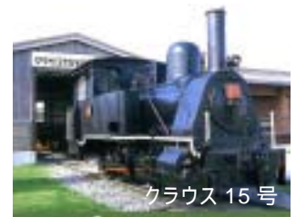
クラウス 15 号

今回は当ツアー限定で、留萌本線 100 周年に併せ特別仕様をご用意します。(協力:高橋商事)