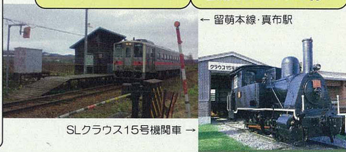
SLクラウス15号機関車 →

そこでこの留萌本線の中でも1日数本発着の旅人を待つ小さな無人駅とその周辺の散歩へ出かけてみませんか？意外な発見があるかもしれません。