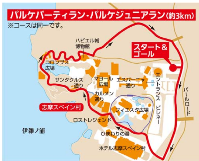
○パルケジュニアラン／パルケパーティランコース図

パルケジュニアラン、パルケパーティランとも、志摩スペイン村を周回するコースを設定。パルケジュニアランはタイムを計測、パルケパーティランは、志摩スペイン村の雰囲気を楽しみながらランニングいただける部門として、大人から子どもまでファミリーでご参加いただけます。仮装での参加もOK。