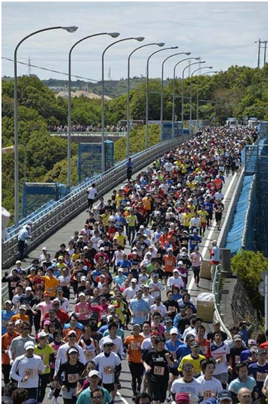
「志摩ロードパーティ ハーフマラソン2013」走行コースの一部

また、本大会のご参加に便利な全席指定、ゼリー飲料とお茶付きの専用列車ツアーを大阪および名古屋方面から実施します。近鉄では、さらに多くの皆様に、大会参加を通じて志摩の景観や美食に触れていただき、再度訪れたい観光地として、伊勢志摩の魅力を再認識していただければと考えています。