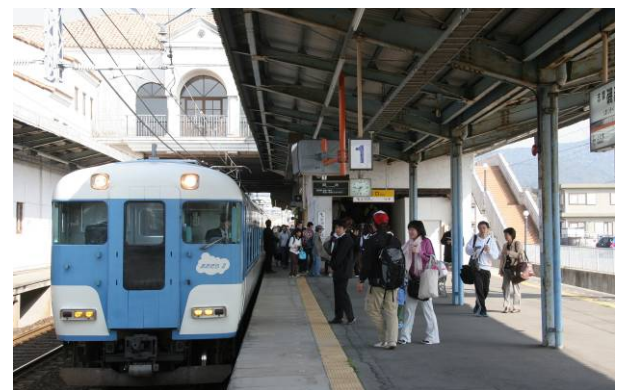
専用臨時列車 「走りゃんせ号」