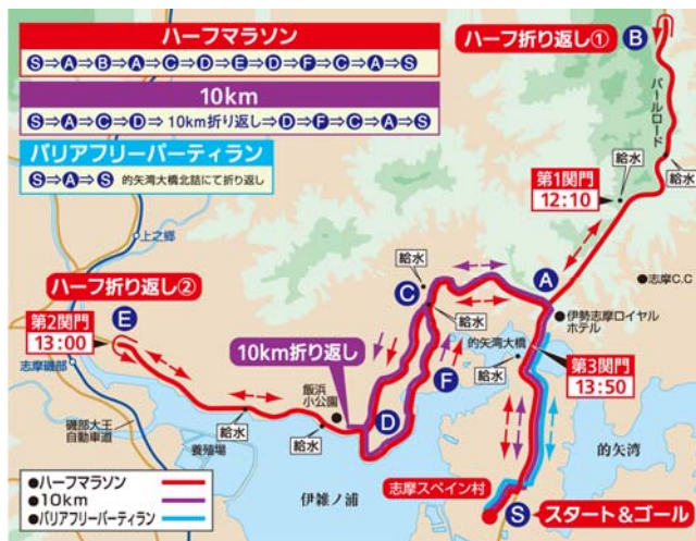
○ハーフマラソン／10km／バリアフリーパーティランコース図

ハーフマラソン・10kmとも前回大会同様、志摩のシーサイドビューにこだわったコースを設定いたしました。ハーフマラソンでは、時間制限のある関門を設定します。バリアフリーパーティランは、的矢湾大橋を折り返す約2kmのコースを設定します。