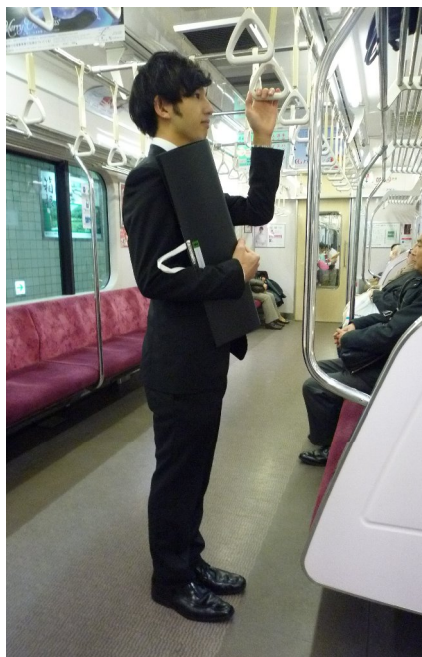
商品を抱えて持ち帰る場合