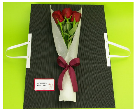
(上)商品の外観 (下)開封した商品