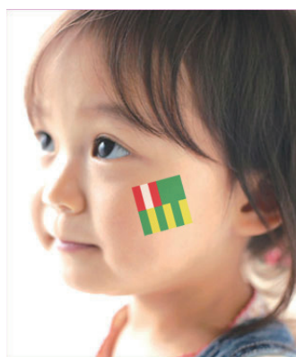
体験プログラムイメージ