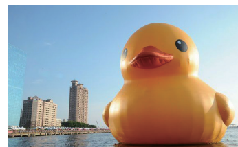
ラバーダック (Rubber Duck)

ラバーダックの作者としても知られるオランダのアーティスト、フロレンティン・ホフマンにより、2011年に兵庫県立美術館の屋上に設置された高さ約8m、幅約10mのカエルのオブジェ。美かえるという名前は700件を超える応募の中から、「かえる」という言葉が復活をイメージしやすく、阪神・淡路大震災からの文化復興のシンボルとしての美術館の設立趣旨と合うことや、「見かえる」「見にかえる」といった語呂のよさなどから決定。今回、ホフマン氏より本プロジェクトへの協力を得られ、特別に美かえるカラーの使用を承認いただいています。