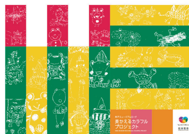
ワークショップの成果物が掲載された壁面装飾