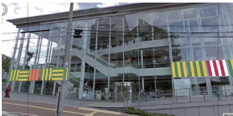
バナー掲出イメージ図（掲出時未定）