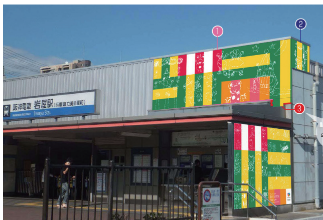
駅舎装飾完成イメージ図

1982 年神戸生まれ。大阪デザイナー専門学校卒業。数社のデザイン制作会社を経て、2006 年に株式会社キュービックデザインの立ち上げに参加。グラフィックデザインを中心に、市民参加型等のイベント企画、アートディレクターも担当。2009 年より大阪デザイナー専門学校非常勤講師も兼務。2012 年にデザイン・クリエイティブセンター神戸 (KIITO) で開催した子どものまちづくりイベント「ちびっこうべ」協力クリエイター。