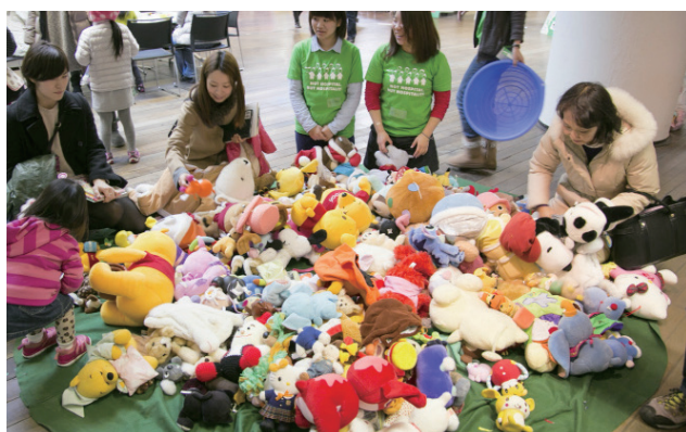
かえっこバザールイメージ