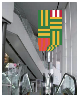
バナー掲出イメージ図（掲出時期未定）