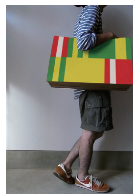
イベント演出ツールイメージ