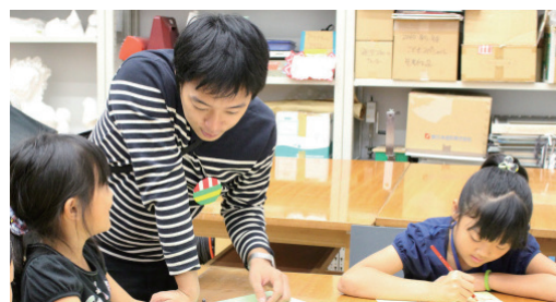
事前ワークショップの様子