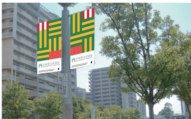
フラッグ設置イメージ図