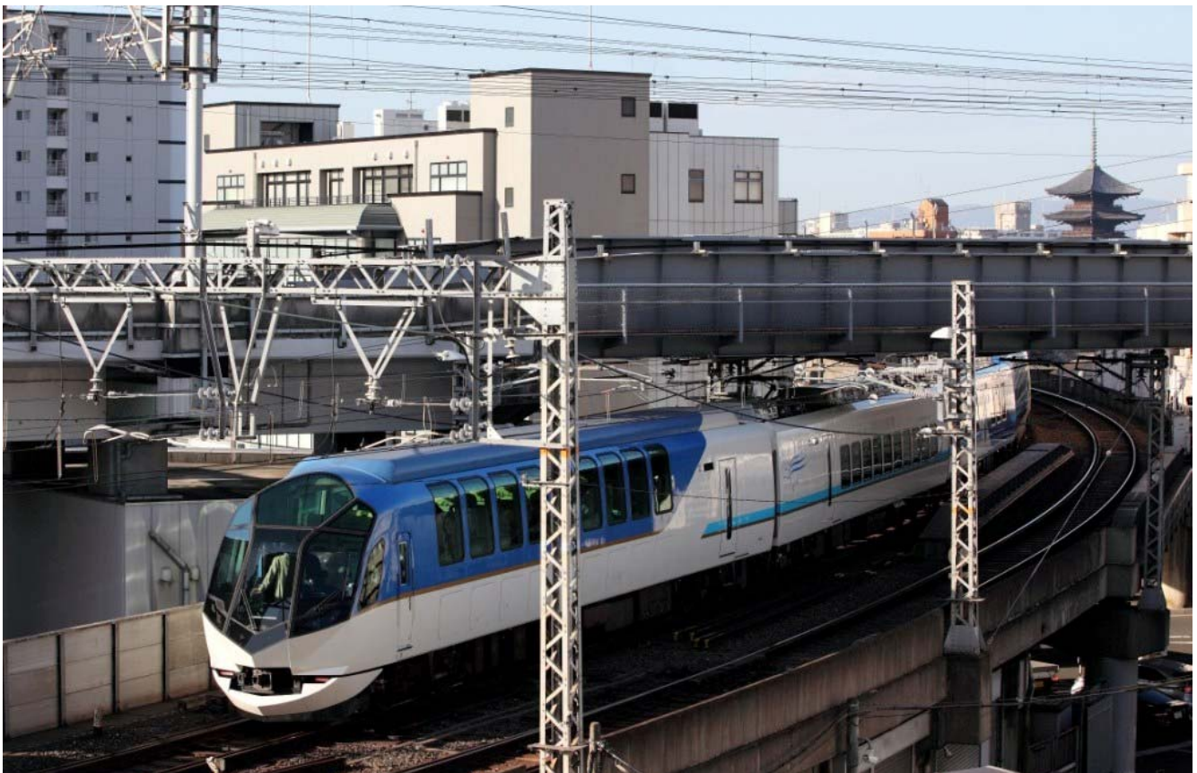
京都駅付近を走行する観光特急「しまかぜ」（臨時列車）