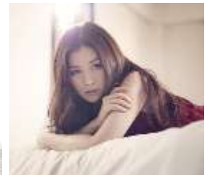
ティーナ・カリーナ