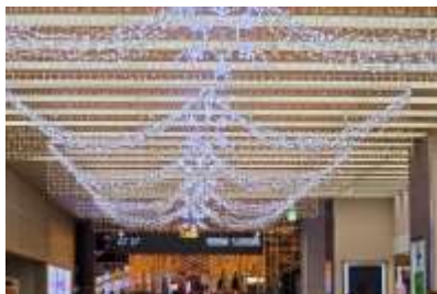
近鉄大阪阿部野橋駅西コンコース天井部

近鉄大阪阿部野橋駅西コンコースでは、約2万球のライトを使った全長約40m・全10列のイルミネーションを天井から垂れ幕（バナー）状に設置します。「あべのハルカス」と同様に、あべのに訪れたお客様の心を「晴るかす（晴ればれとさせる）」道となります。