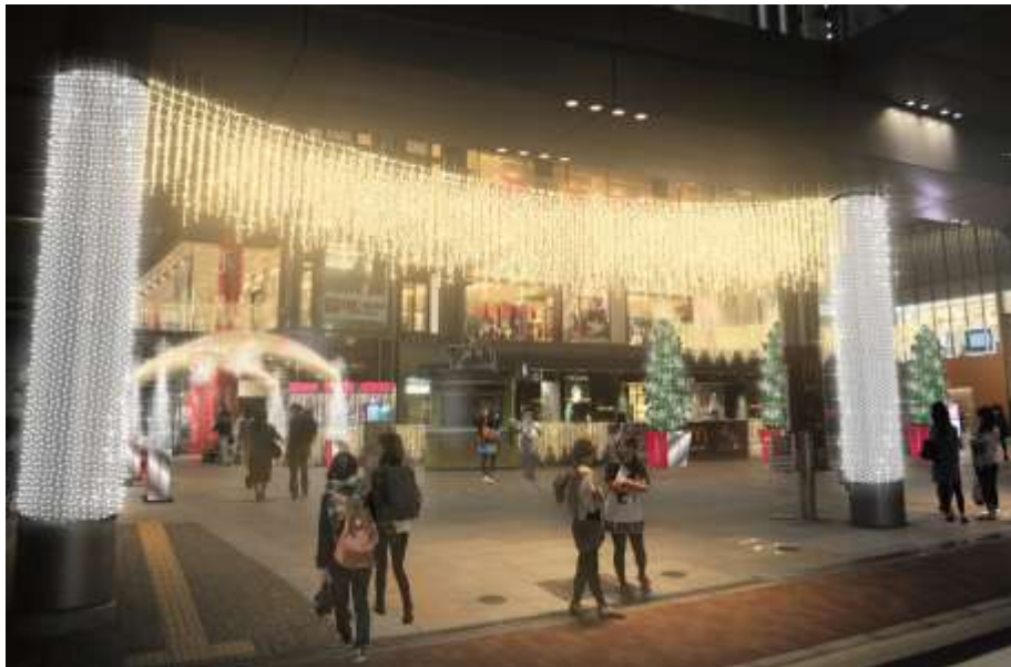
Hoop1階エントランスゲート

これにより、Hoopを中心に、and、近鉄大阪阿部野橋駅、あべのハルカス近鉄本店に広がるLEDの ライト約20万球・全長約160m の光のゲートが誕生します。