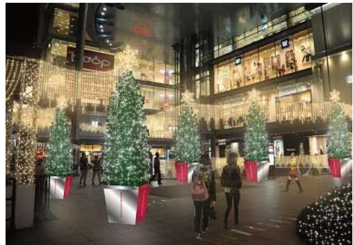
Hoop1階オープンエアプラザ

「Hoop」1階オープンエアプラザには、近鉄百貨店のクリスマスのイメージキャラクターである、 ムーミンとムーミン谷の仲間たちのオブジェ が登場します(11/7(木)~12/25(水))。