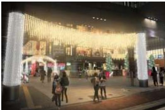
Hoop1階エントランスゲート

2005年より毎年恒例のイルミネーションゲートです。今年は、 約15万球 のライトを使用。近鉄大阪阿部野橋駅西改札口南のメインゲートから「Hoop」南側の「and」に通じるイルミネーションを中心に、全長約120mの光のゲートが輝きます。