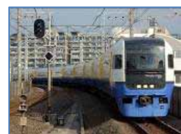
わかしお号 255系(イメージ)

JR 千葉支社ホームページ http://www.jreast.co.jp/chiba/ よりお申込ください。