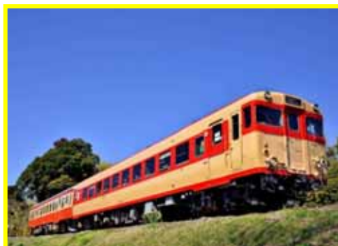
いすみ鉄道気動車 キハ28 キハ52(イメージ)

キハ30・・・久留里線で活躍していた気動車。現在は、いすみ鉄道の国吉駅構内に展示されている。