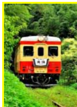
いすみ鉄道気動車 キハ52(イメージ)