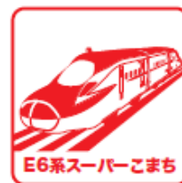
スタンプイメージ