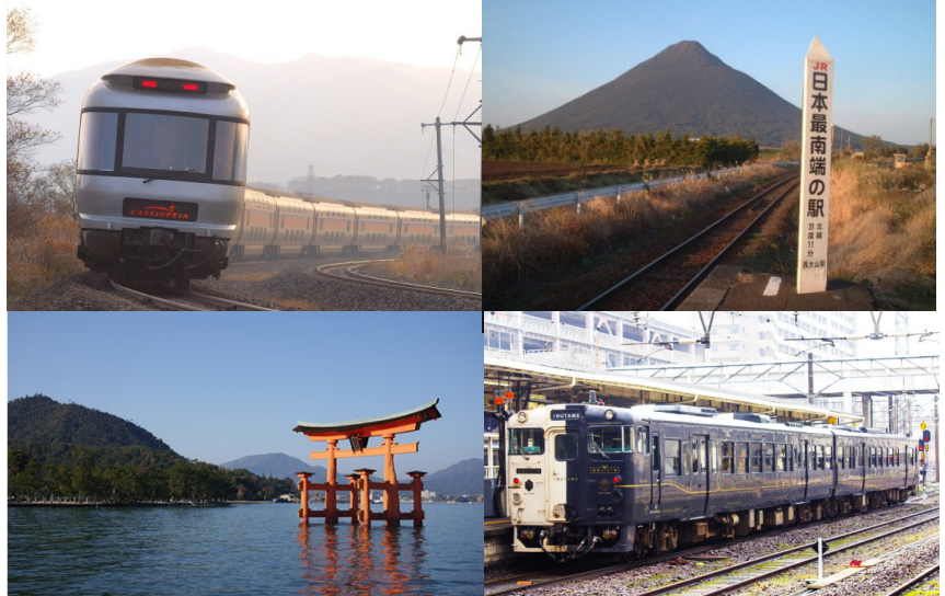
※左上：寝台特急カシオペア 右上：西大山駅 左下：宮島・厳島神社 右下：JR九州「指宿のたまて箱」 ※写真はイメージです。