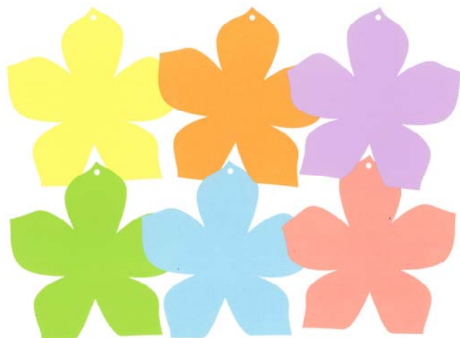
オリジナル短冊（全部で6色用意しています）