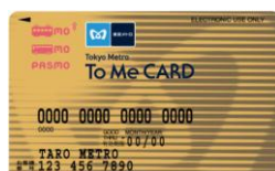
To Me CARD PASMO ゴールドカード