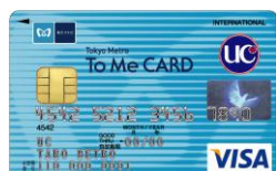
To Me CARD UC 一般カード