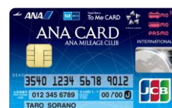
ANA To Me CARD PASMO JCB (愛称: ソラチカカード)

※券面画像はイメージです。※To Me CARD Prime は、JCB・ニコスからご選択いただけます。