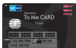
To Me CARD Prime