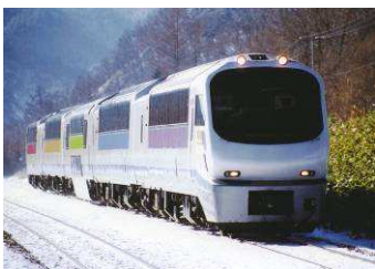
変更前の車両（ノースレインボー車両）