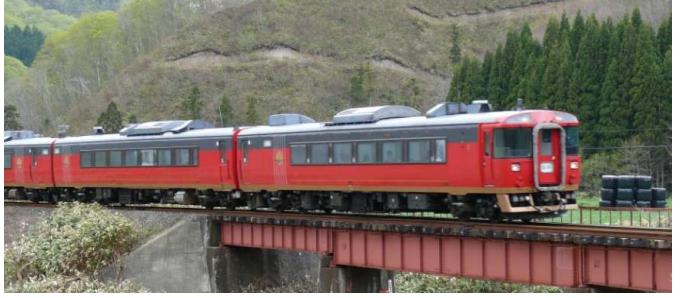
キハ183型特急型お座敷気動車(イメージ)

江差線 木古内～江差間は、1936年(昭和11年)に湯ノ岱～江差間が開業し全線が開通しました。以来約80年の長きにわたり、たくさんのお客様にご利用いただきましたが、平成26年5月11日の営業運転をもちまして廃止させていただくこととなりました。 JR北海道では、車内でゆっくりお過ごしいただける、特急型お座敷車両を使用した臨時列車を函館～江差間で運転し、江差への列車の旅をお楽しみいただくツアーを企画致しました。 江差到着後は町内を循環する、臨時列車ご乗車のお客様専用のシャトルバスを運行しますので、江差追分会館や開陽丸、中村家や横山家など、歴史情緒溢れる江差の町をお楽しみください。