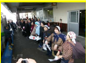
左記は予定です。変更となる場合がございますので、あらかじめご了承ください。