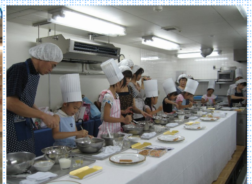
パティシエ体験教室