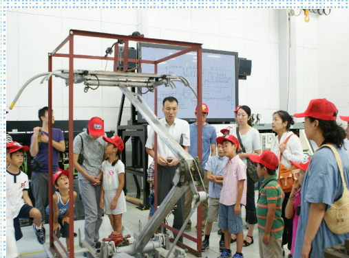
ファミリー鉄道教室