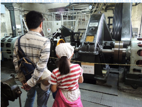
NEW 大山ケーブルカー見学会