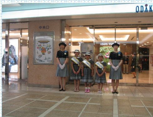
デパートガール体験