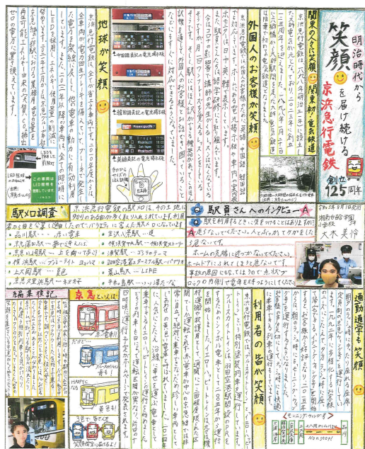
第17回新聞コンクール最優秀作品