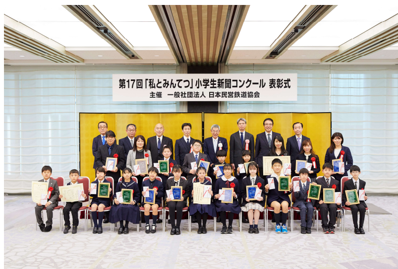
第17回新聞コンクール表彰式の様子（東京 経団連会館）