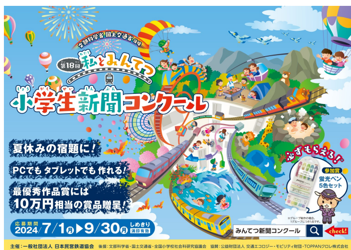
掲出ポスター（列車内用）