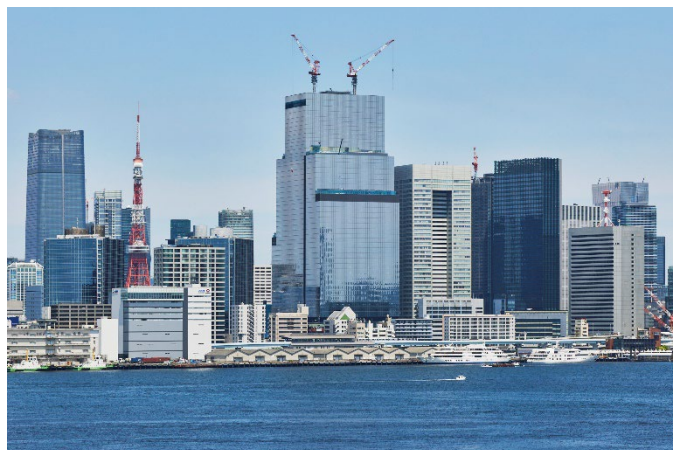
【S 棟の工事状況・2024 年 5 月下旬時点】