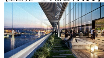
【空と海を一望するスカイラウンジ】

中層部のオフィフロアでは、都内有数の約 1,500 坪のメガプレートを備えており、一人ひとりに寄り添う、芝浦の豊かな自然環境を活かした「TOKYO WORKation」を提唱しています。空と海の開放感を体感できるテラス付きの共用部「スカイラウンジ」をはじめ、街全体をワークスペースとして利用でき、その多様なワークスペースをアプリ等のデジタルの施策で支援します。一人ひとりがより良いパフォーマンスを発揮できるように、そのコンディションに合わせたワークシーンを選択できる働き方を実現します。