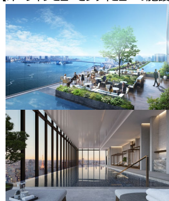
【オーシャンビューとシティビューの施設】

【2022 年 5 月 23 日発表「フェアモント東京」芝浦・浜松町エリアに 2025 年度開業】 URL: https://www.nomura-re-hd.co.jp/cfiles/news/n2022052302033.pdf