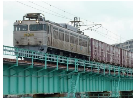
EF81 形式 303 号機