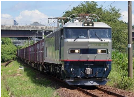
EF510 形式 300 番代