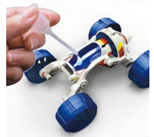
燃料電池バギー (イメージ)