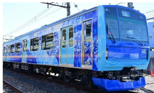
水素ハイブリッド電車「HYBARI（ひばり）」