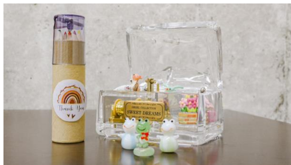
虹の色鉛筆プレゼントキャンペーンイメージ