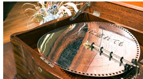
アンティーク・オルゴール