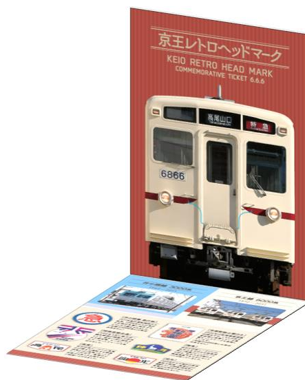
≪台紙内側 イメージ≫