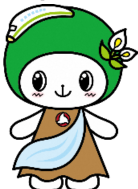
西郷村イメージキャラクター 「ニシゴージュ」