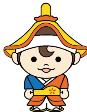
古殿町イメージキャラクター 「やぶさめくん」