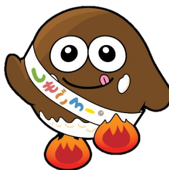
下郷町観光 PR キャラクター 「しもごろー」