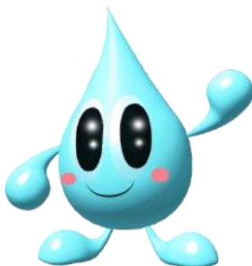
福島県 県南地方振興局キャラクター 「みなもん」