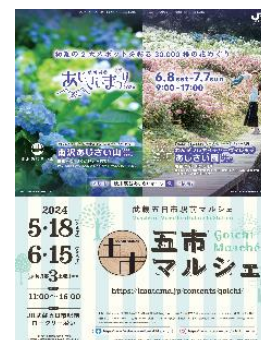
【五市マルシェ・あじさいまつりポスター】

武蔵五日市駅前にて、五市マルシェ実行委員会が厳選した商品を販売します。これまでの出店では、全国でも高い評価を得ている秋川の清流で育った鮎を使った調味料、多摩産材で作ったキッズチェアやまな板、和紙の雑貨、自然や動物をモチーフにした陶器のオブジェ苔のアクアリウムなどを販売しました。