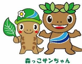
森っこサンちゃん