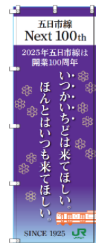
【オリジナルのぼり旗】