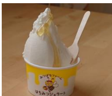
【みつばちファーム】