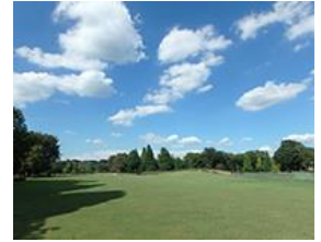
【風景：都立秋留台公園】