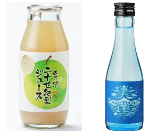
左：<贅沢二十世紀梨ジュース>