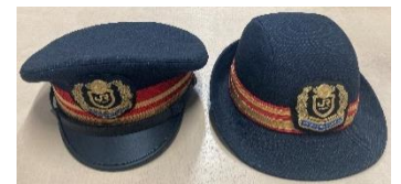
< こども制帽 >