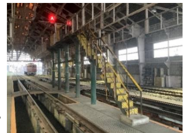
屋根上点検台・昇降階段