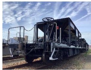
ホキ 800 形貨車

2024年6月15日（土）・16日（日） ・第1部 10:30 ～ 12:30 ・第2部 14:00 ～ 16:00 ※撮影時間は各部 90 分程度を予定。