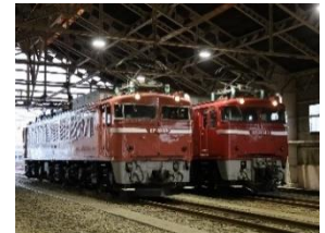
収容庫内・庫内照明