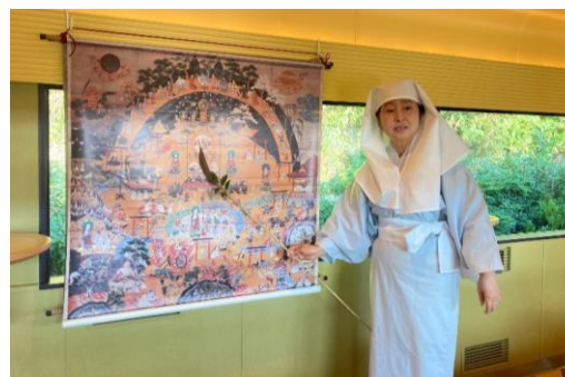
熊野曼荼羅絵解き