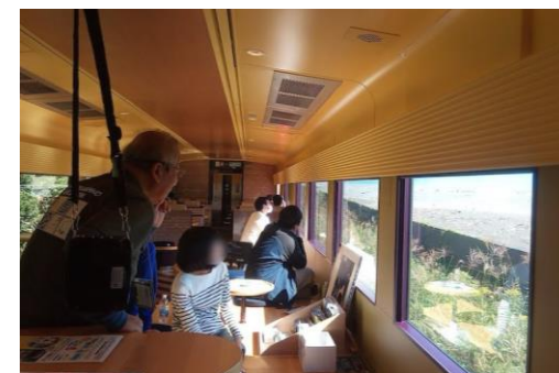
ジオパークガイド解説