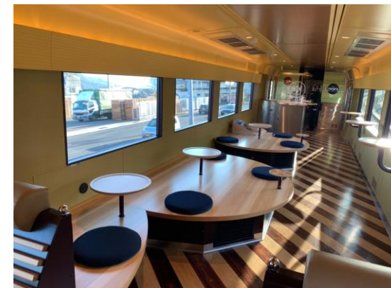
4号車フリースペース