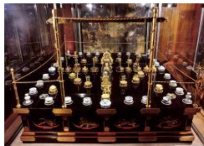
金剛界成身会三摩耶形（金剛界立体曼陀羅）