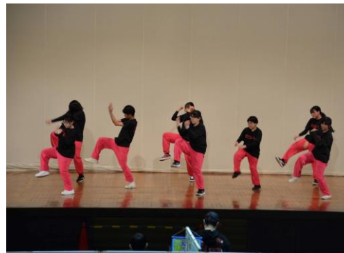
沿線学生のダンス披露