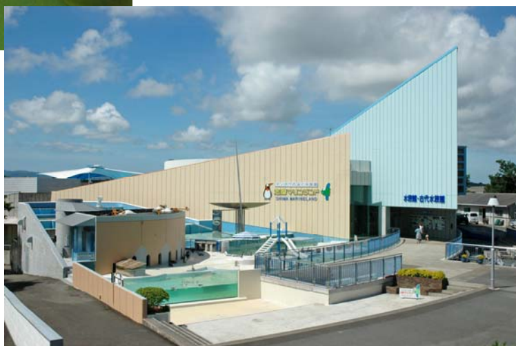
志摩マリンランド