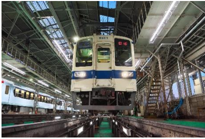
<月検査場線(ピット線)>