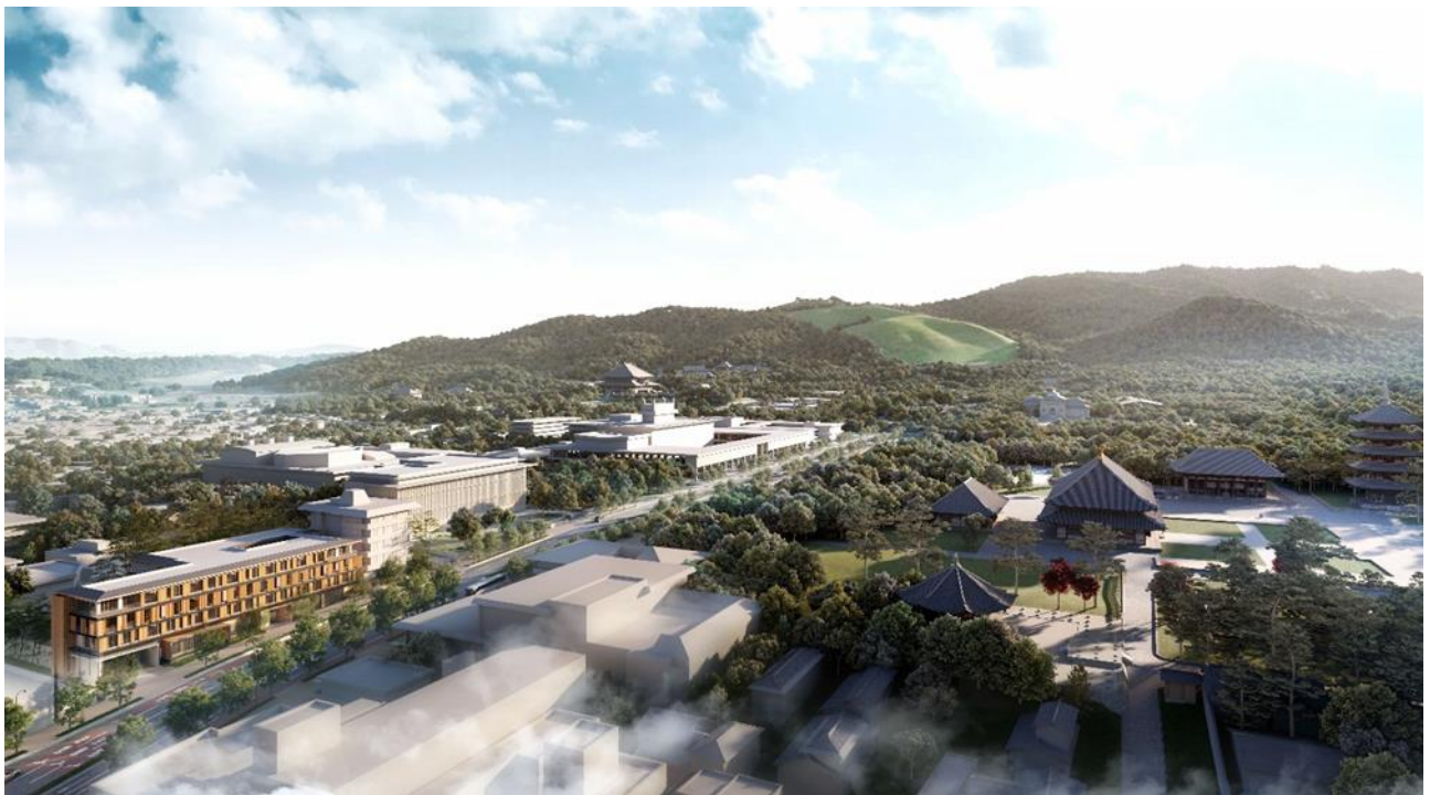
全体鳥瞰図（イメージ）