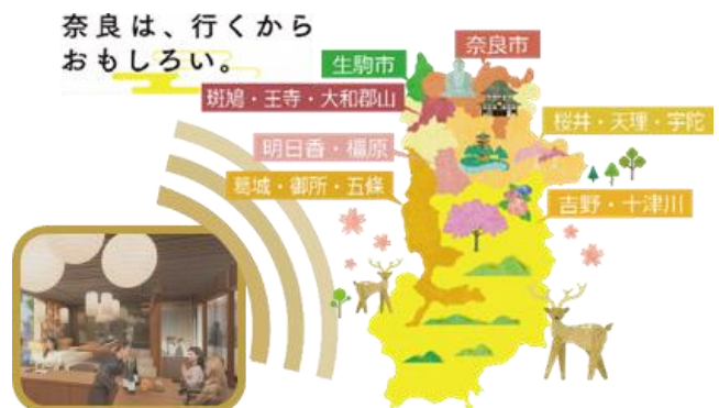
ホテル拠点の周遊観光（イメージ）