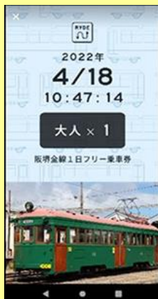
チケット画面イメージ

【購入方法】お手持ちのスマートフォンでRYDE社が運営するアプリ「RYDE PASS」からすぐにご購入いただけます。