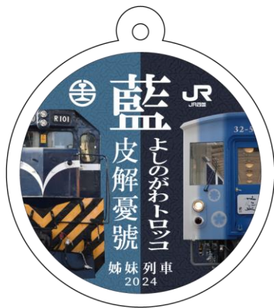
①アクリルキーホルダー（イメージ）